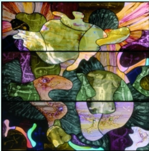
Apocalypse , Marc Mulders, 2006 Objectnummer: StCC v142

Er is geen tijd meer te verliezen, denk aan klimaatverandering en milieuvuiling. Er zijn kunstenaars die ons willen wakker schudden en waarschuwen, ons aan het denken willen zetten door middel van hun kunst.