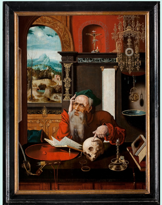
Hiëronymus in zijn studeervertrek naar Joos van Cleve, ca. 1545 Objectnummer: RMCC s366