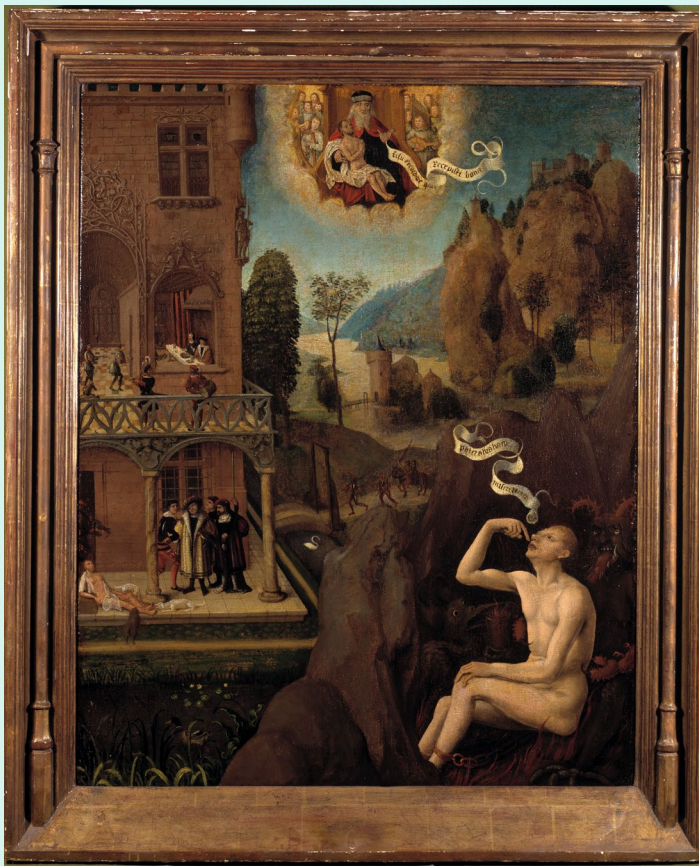
Lazarus en de rijke man , Brugge?, 1515-1525 Museum Catharijneconvent, Utrecht Objectnummer: StCC s1