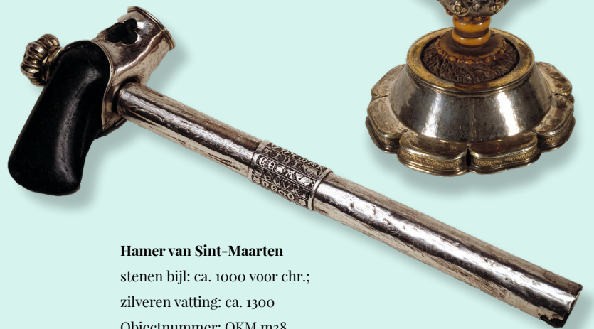
Lebuïnuskelk , Aken, 790-810 Museum Catharijneconvent, Utrecht Objectnummer: ABM bi787