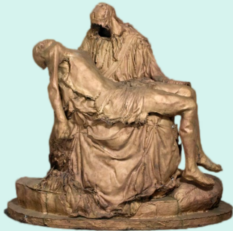
Pietà , Caspar Berger, 2006 Objectnummer: StCC b48