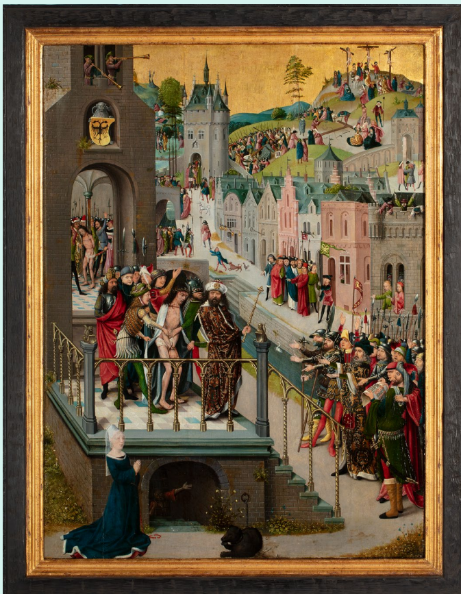
Ecce Homo , Maker onbekend Nederrijn?, ca. 1480 Objectnummer: RMCC s375